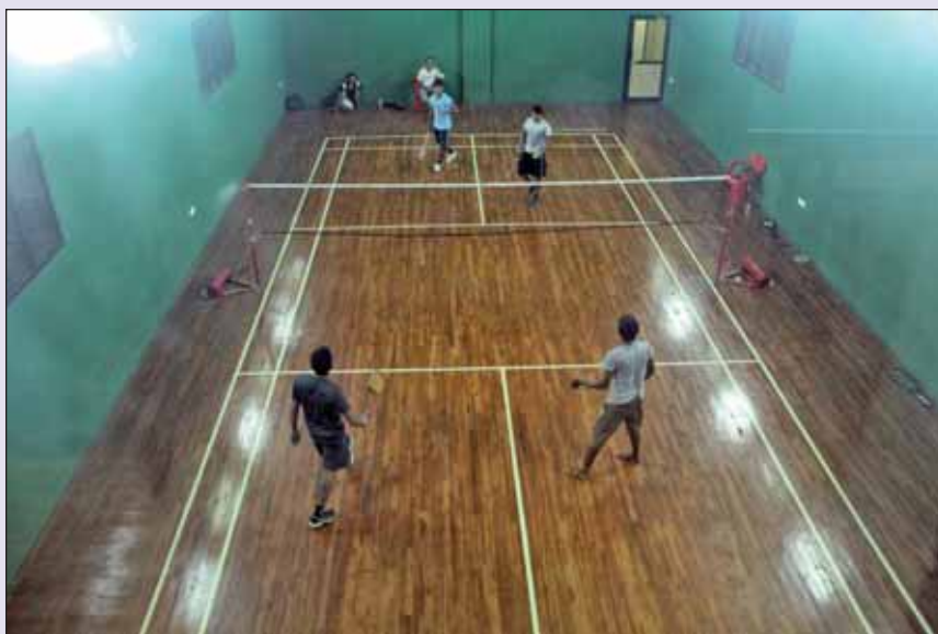
Sports Complex - Indoor Badminton Court चित्र : क्रीडा काम्प्लेक्स – इंडोर बैडमिंटन कोर्ट