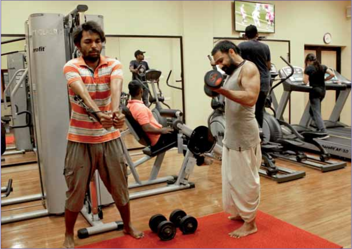
Sports Complex - Modern Gymnasium चित्र : क्रीडा काम्प्लेक्स – आधुनिक जिमखाना