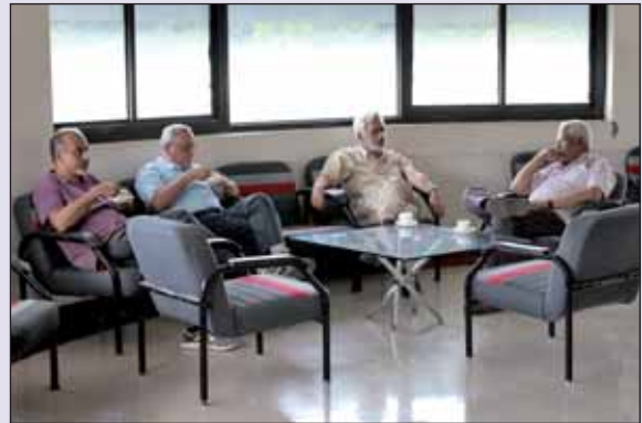
Coffee Pantry चित्र : कॉफी पैंट्री