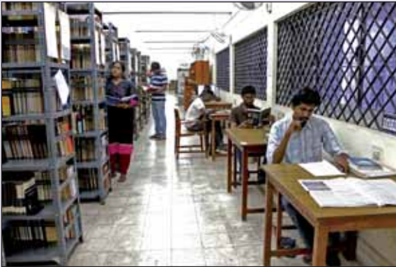
Library Reading Hall चित्र : लाइब्रेरी रीडिंग हॉल