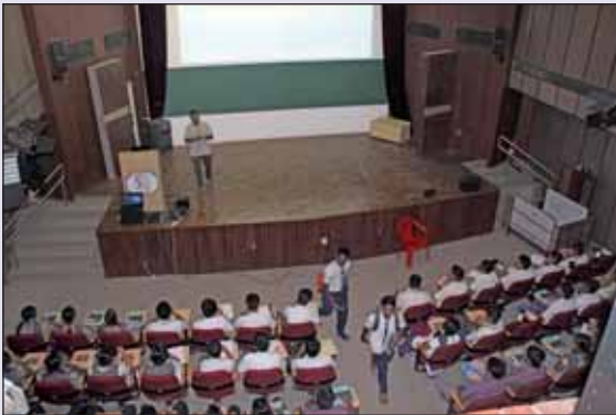
'One Percent, 2016', 21st October, 2016

चित्र : "गणित शिक्षण संवर्धन 2016", 26 से 27 सितंबर 2016