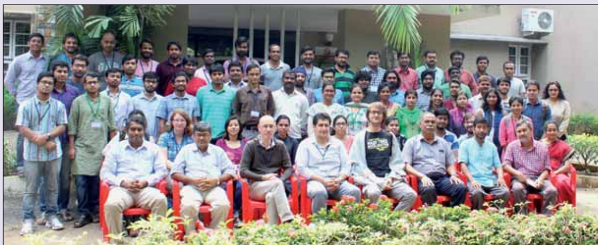
2nd IMSc School on Quantum Information, 5th-17th December, 2016

चित्र : 'क्वांटम सूचना पर दूसरा आईएमएससी स्कूल', 5 से 17 दिसंबर 2016