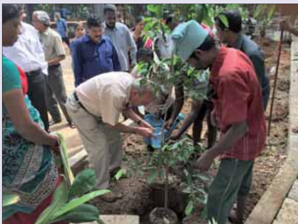
Tree Plantation Drive at Campus on 7th October, 2016

चित्र : 7 अक्टूबर 2016 को कैम्पस में वृक्षारोपण अभियान