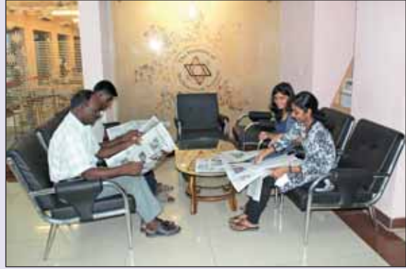
Guest House Canteen - Lounge चित्र : अतिथि गृह कैटीन - लॉज