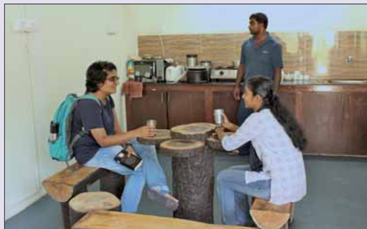
Night Pantry चित्र : नाइट पैंट्री