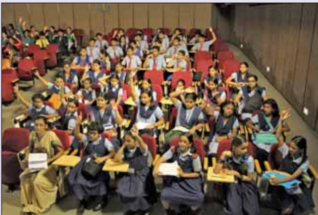
Hindi Competitions for School students on 15th September, 2016

चित्र : 23 सितंबर 2016 को आयोजित हिंदी दिवस