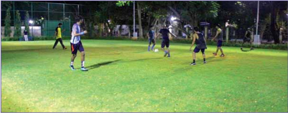
Mini Football Ground चित्र : मिनी फुटबाल मैदान