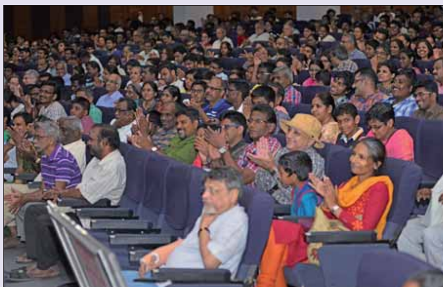
Science outreach programme - 'Science at the Sabha', 26th February, 2017

चित्र : 'क्वांटम सूचना पर दूसरा आईएमएससी स्कूल', 5 से 17 दिसंबर 2016