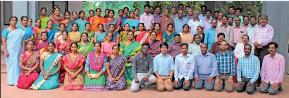
Enriching Mathematics Education 2016', 26th-27th September, 2016

चित्र : "गणित शिक्षण संवर्धन 2016", 26 से 27 सितंबर 2016