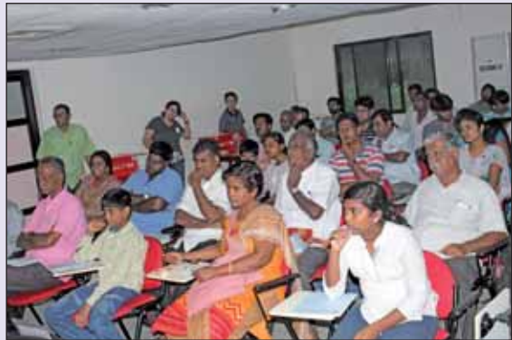
Foldscope', Workshop for TNSF, 19th November, 2016

चित्र : 'एक प्रतिशत, 2016', 21 अक्टूबर 2016