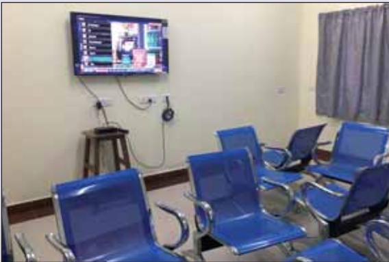
Students Hostel – TV Hall चित्र : छात्रावास – टीवी हॉल