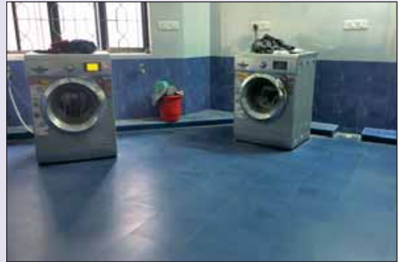
Students Hostel – Laundry चित्र : छात्रावास - लांड्री