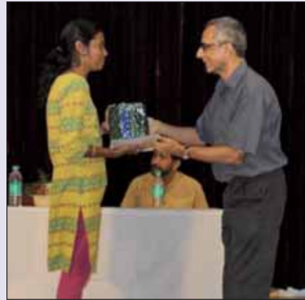
Hindi Day held on 23rd September, 2016

चित्र : फ्रेशर्स डे 2016-17, 9 सितंबर 2016