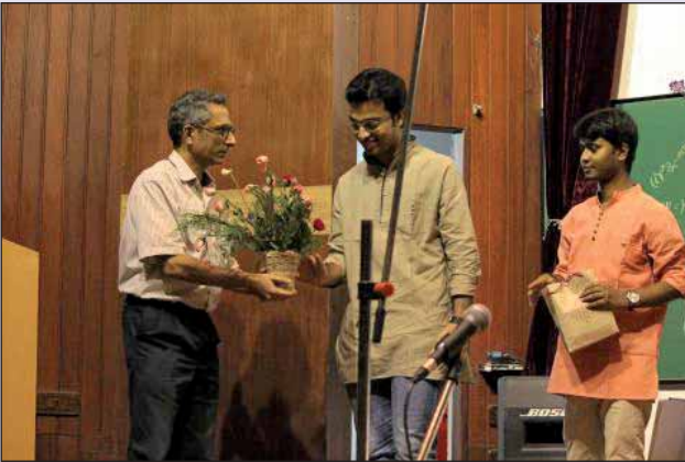
Freshers Day 2016-17, 9th September, 2016

वर्ष 2016-17 के दौरान संस्थान में आयोजित अन्य गतिविधियाँ