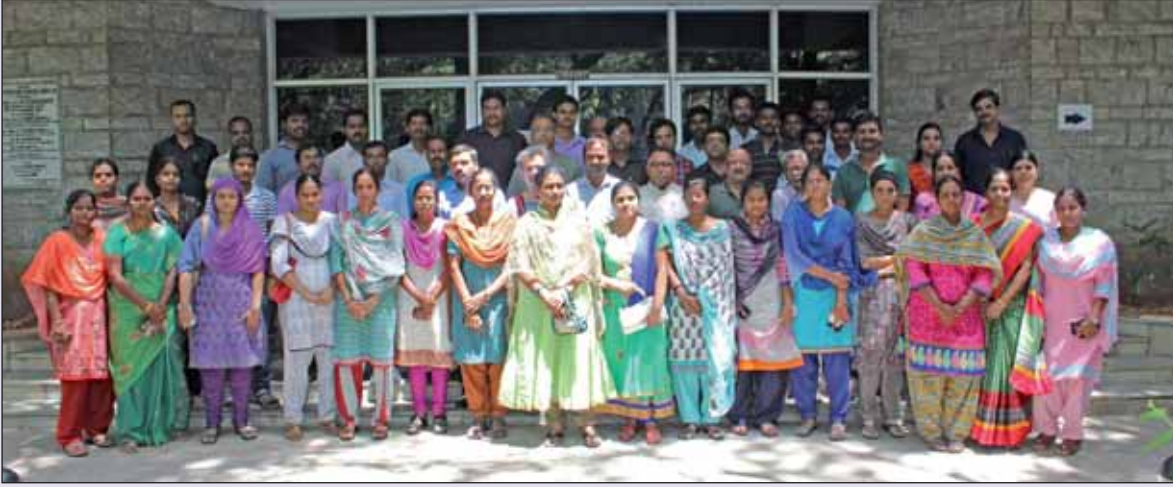
Teachers Enrichment Workshop: Algebra and Analysis', 23rd-28th May, 2016

चित्र : "शिक्षक संवर्धन कार्यशाला : बीजगणित एवं विश्लेषण",