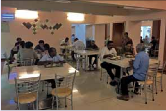
Guest House Canteen - Dining Hall चित्र : अतिथि गृह कैटीन – डाइनिंग हॉल