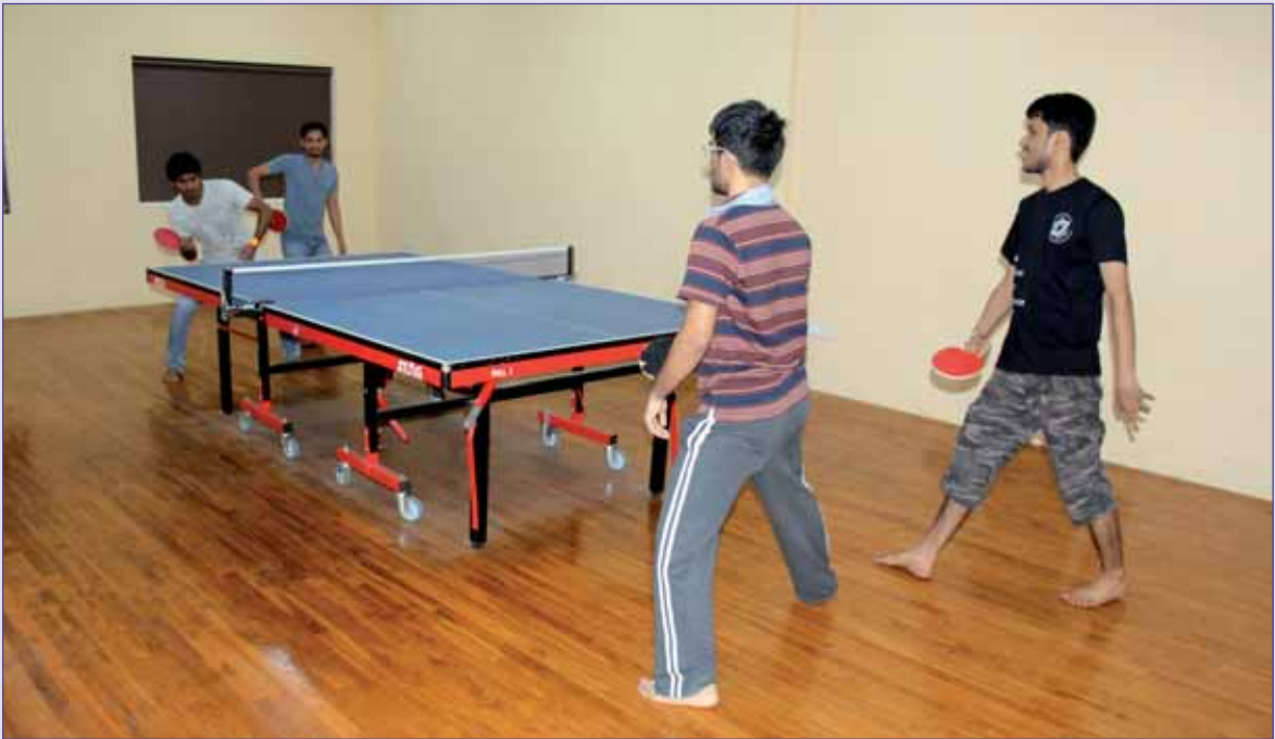
Sports Complex - Table Tennis चित्र : क्रीडा काम्प्लेक्स – टेबल टेनिस